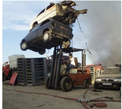
Imagen de archivo de un desguace de automóviles.

En la jornadas informativas también están colaborando Sigrauto y las asociaciones que la componen (Anfac, Aniacam, Aedra y la Fer).